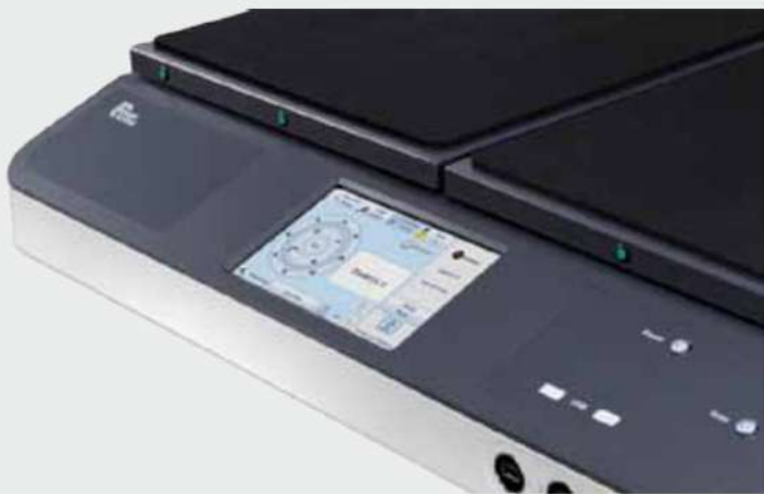
Gran pantalla táctil para simplificar la operación

Si los requisitos del escáner se vuelven más exigentes con el tiempo, el Bookeye® 4 Basic se puede actualizar de forma rápida y sencilla. Esto protege su inversión a la vez que le permite añadir funcionalidad, como las opciones de software o interfaz con asistente de escaneo por lotes u otros clientes de captura. La Pantalla táctil a color simplifica la operación.