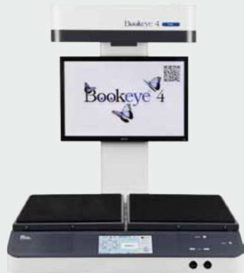
Vista Frontal del Bookeye® 4 Basico