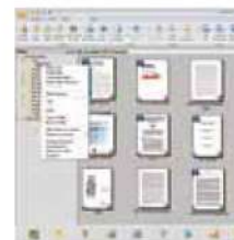
Pantalla principal de PaperPort SE14

- La opción profesional para organizar y compartir tus documentos