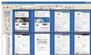
Pantalla principal de AVScan X

-La herramienta inteligente de manejo de documentos