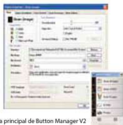
Pantalla principal de Button Manager V2